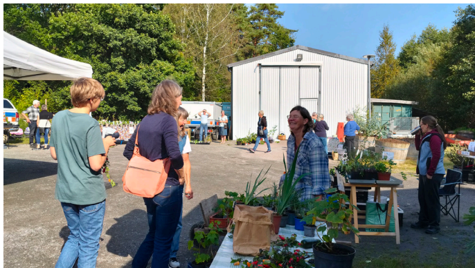
Vackert höstväder för årets växtmarknad

Vår höstmarknad är återkommande och välbesökt. Besökarna kan köpa från olika försäljare, kolla på plantor som växthusgruppen odlat, få sin frukt sortbestämd av våra pomologer eller ta en stunds paus med gofika. Denna gång hade vi så fint väder att det blev en aning för varmt inne i växthuset där det fanns några försäljare och en fruktutställning.