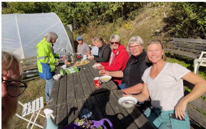
Här sitter vi och njuter i solen med lite sopplunch

Vi träffades ett gott gäng o skulle gjuta i betong denna fina höstdag. Vissa var nya medan andra hade gjutit förut.