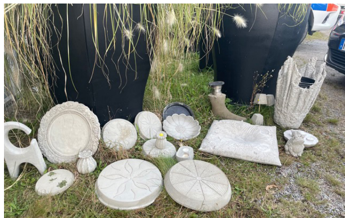
Några av alla fina alster som gjutits

Med allt rörande och skakande av betongen så gick tiden väldigt fort.