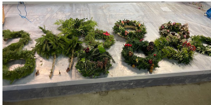
Julkransar i olika former

Vi har även en tradition av att binda kransar i våran trädgårdsgrupp. Så roligt dom blir så fina och olika. Det blev också några granar.