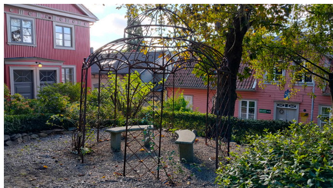
Den nya paviljongen i Bergfeltska trädgården

Presentation av trädgården är viktig. Vi jobbar med ny informationsfolder, skyltar och planerar för guidning i trädgården.