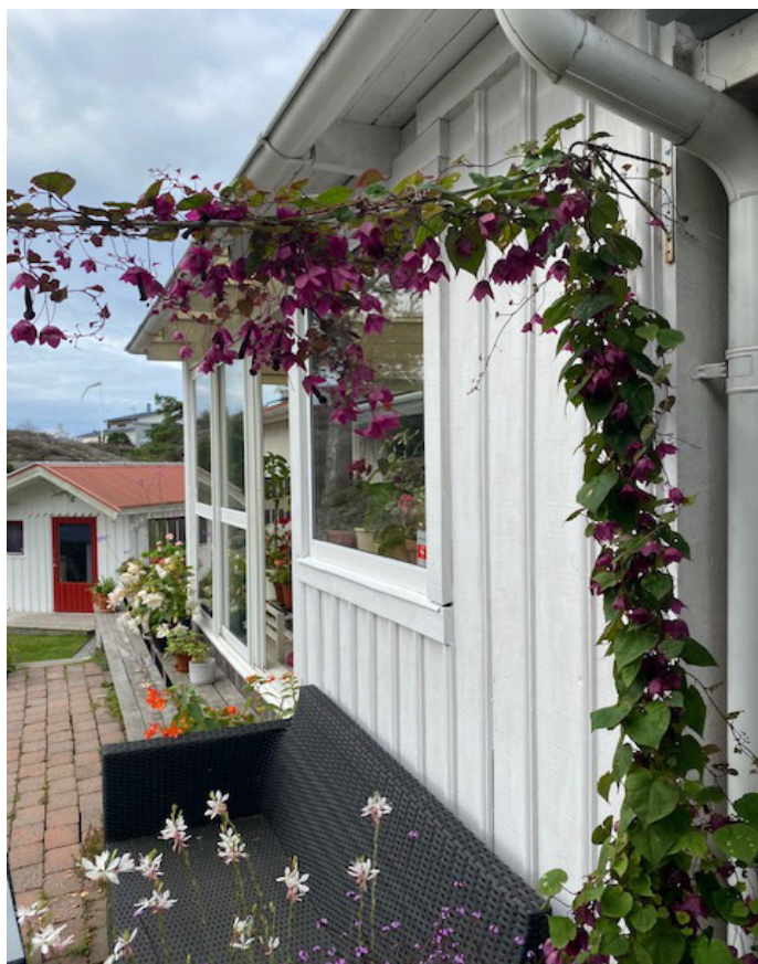
Törnrosas kjortel (sådda av Växthusgrupperna)