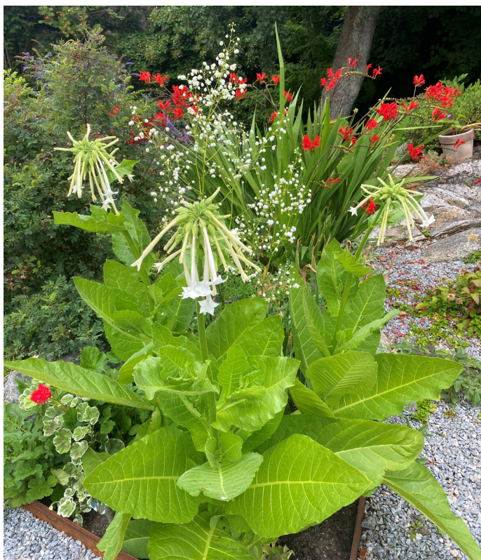
Tobaksblommor (sådda av Växthusgrupperna)