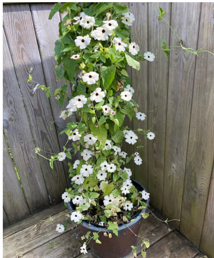
Svartöga (sådda av Växthusgrupperna)