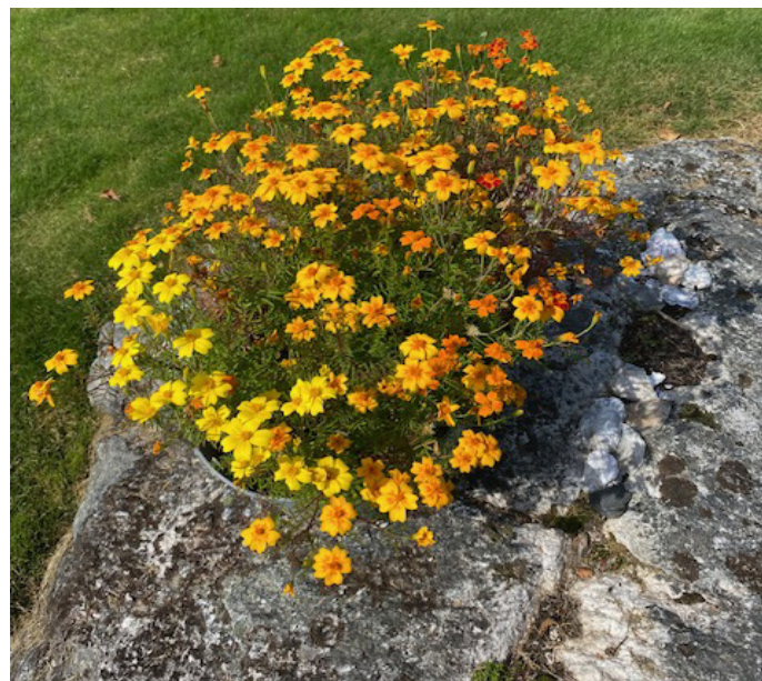
Kryddtagets (sådda av Växthusgrupperna)