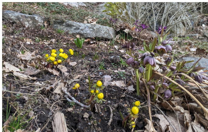
Vintergäck och julros