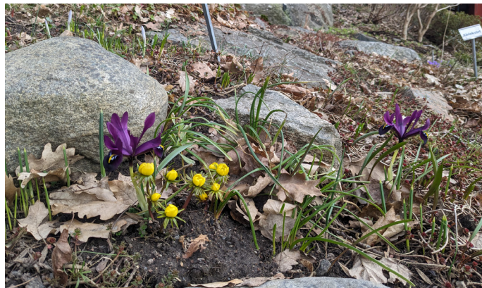
Vintergäck och snöiris