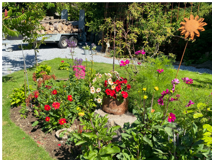
/Inez Öppna trädgårdar

Våra medlemmar har fina trädgårdar, kanske ni vill visa upp dessa för andra medlemmar, grannar kommer också gärna på besök. Datum bestämmer ni själva, hör av er till styrelsen om ni vill vara med!