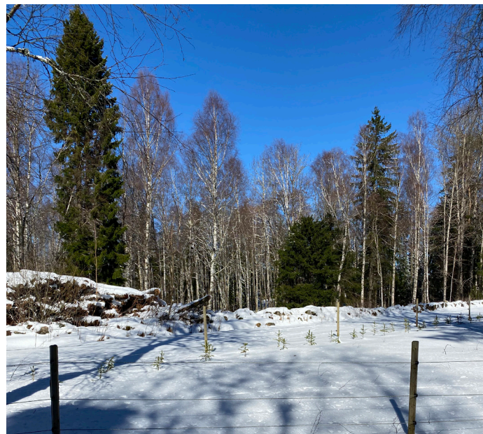
Magnoliacaféet på vintern

Det är väldigt fint att åka hit i augusti och september när Dahliorna blommar. Café med varma smörgåsar och god fika.