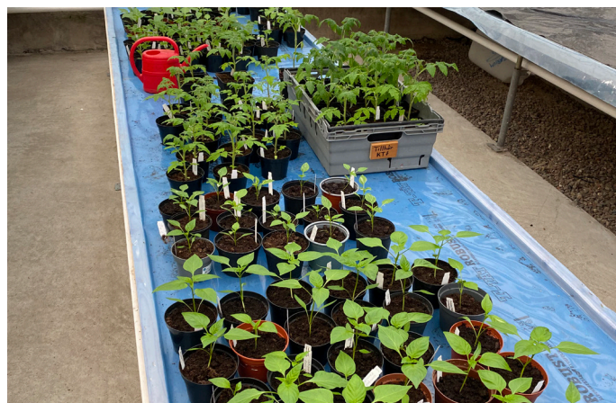
Försådd i växthuset

Välkomna på Växtmarknaden lördagen 27 maj med Café med hembakat.