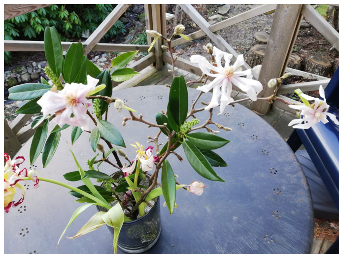
Magnolia och lagerhägg i vas