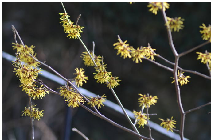
Trollhassel blommar på bar kvist

Inomhus kan man ta vara på att det börjar bli ljusare. Men tänk på att tidiga frösådder behöver ha tilläggsbelysning när de har grott och börjar växa upp. Och det är en bra tid att göra omplantering av rumsväxter; att de får ny kraft med jord och näring. Övervintrade pelargoner och bloddroppar kan klippas ned samtidigt som de får ny jord. Och då kan man ta vara på skotten för att rota dem i vatten eller direkt i en kruka. Utomhus kan man plantera pensé, tusensköna, gyllenlack och andra blommor som tål frost. Rengöring i växthus och uterum kan nu vara en försäkring att det inte finns övervintrande ohyra från förra växtsäsongen.