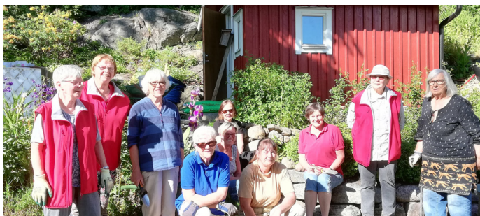
Skötselgruppen för Bergfeltska trädgården