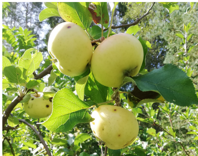
Oranie med frukt

En av de nyplanterade är sorten Oranie. Oranie är en gammal äppelsort, med okänt ursprung, vilken fanns i Sverige och Finland före 1850 och anses ha spridits från Skåne. Fruktarna mognar i september–november och kan odlas i zon I-V. Äpplet har ett saftigt och sött fruktkött, som kan bli klart, och lämpar sig bäst som dessert- och matäpple. Trädet börjar bära frukt tidigt och fortsätter att ge rikligt med äpplen. Det har utsetts till landskapsäpple för Dalsland.