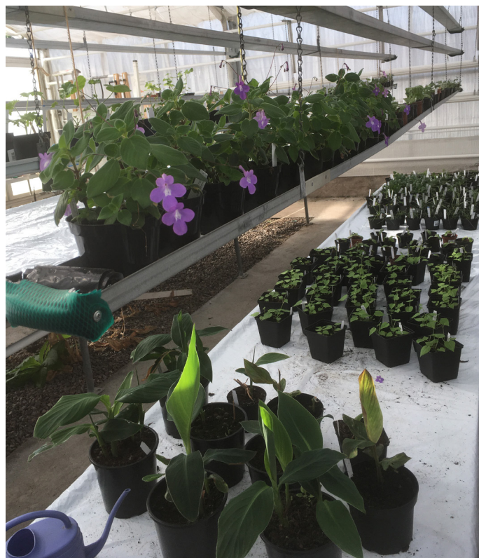
Plantor i växthuset

För att minska risken för trängsel så bjöd vi in våra medlemmar i olika omgångar. Under två onsdagar, ett tillfälle mitt på dagen och ett under kvällen. Försäljningen var i Växthuset och perennerna var ute i pallkragarna.