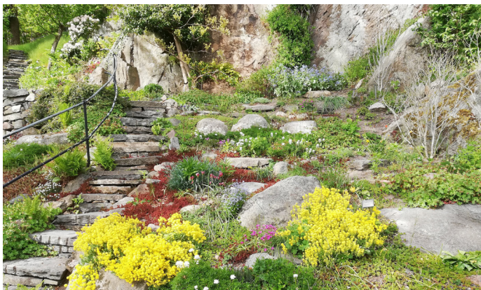
Stenpartiet i Bergfeltska trädgården