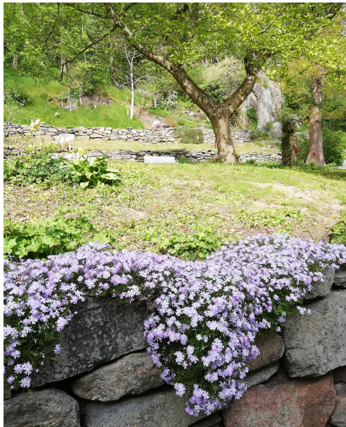
Mossflox i muren Bergfeltska