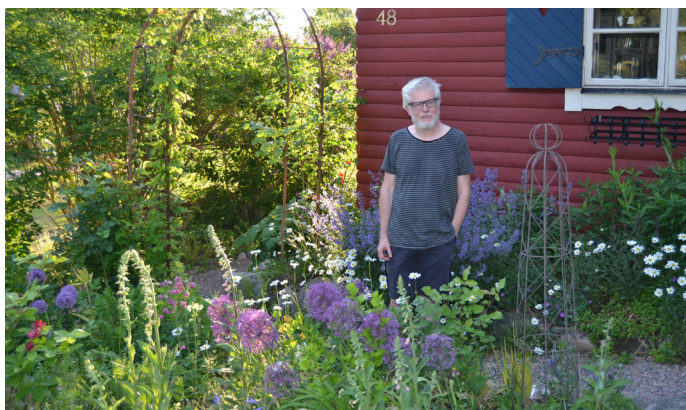
Lengstrand i Lökeberg

OdlarSture , Dösebacka 390, 44291 Romelanda. Trädgården ligger högst upp på Dösebackaåsen 6 km från Kungälv. En trädgård där glädjen till odlandet är det som gäller.