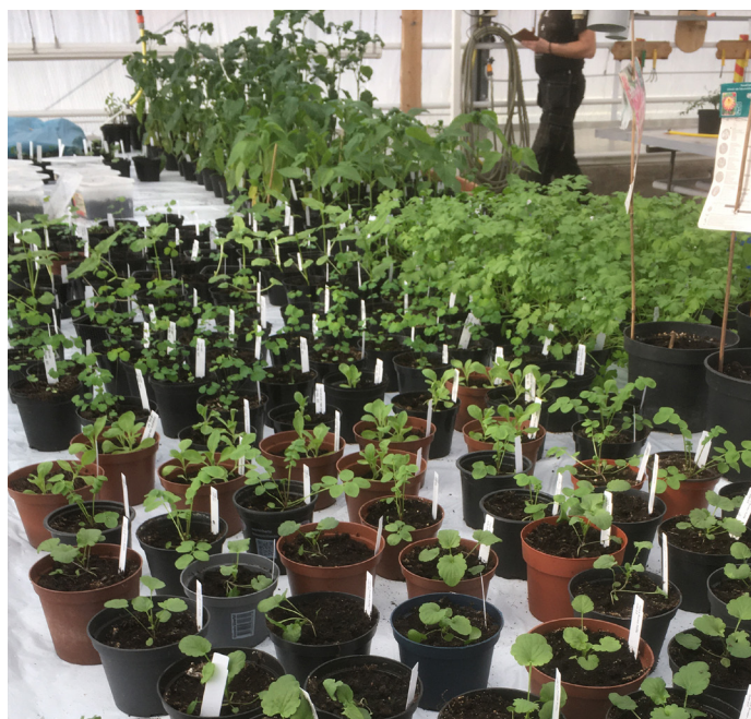
Plantor till försäljning i växthuset

Vår växtmarknad kunde tyvärr inte genomföras som vanligt. Det mesta hade såtts innan covid19 slog till så vi hade ungefär samma mängd plantor som ett vanligt år. Det omskolades lite färre plantor, men trots det var det många som behövde hitta nya ägare.