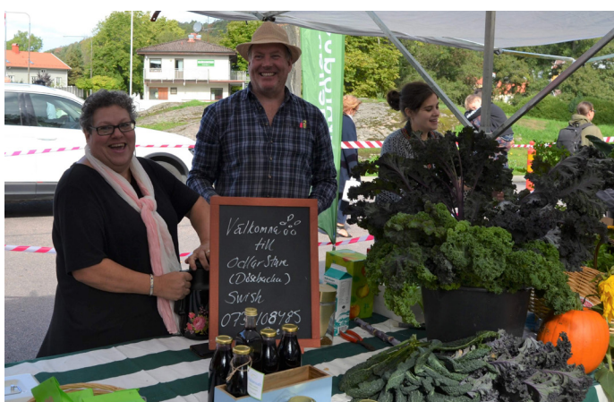
Odlarsture som deltar i Tusen trädgårdar.

OdlarSture , Dösebacka 390, 44291 Romelanda. Trädgården ligger högst upp på Dösebackaåsen 6 km från Kungälv. En trädgård där glädjen till odlandet är det som gäller.